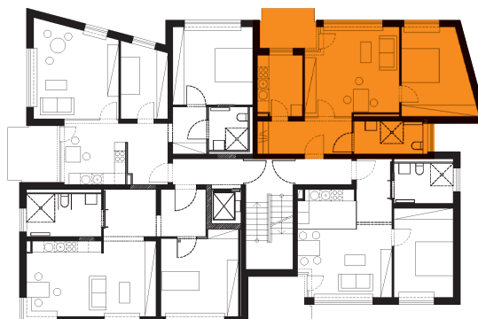
Lageplan 1. Obergeschoss