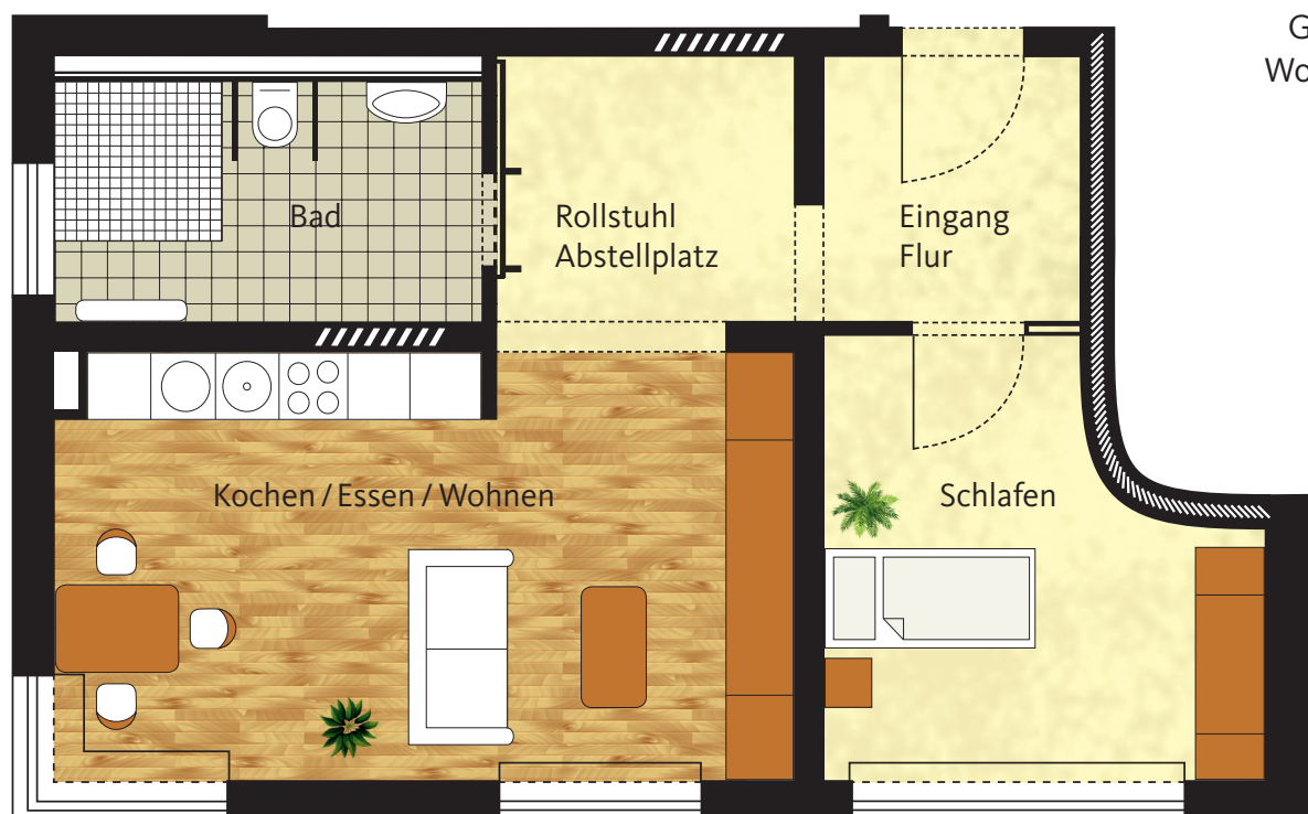
Grundriss Wohnung 2