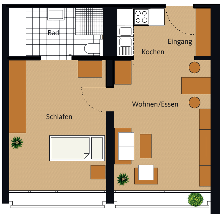
Grundriss Wohnung 721