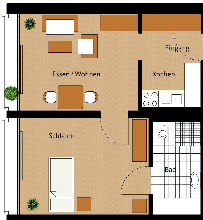
Grundriss Wohnung 527