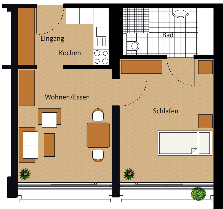
Grundriss Wohnung 522