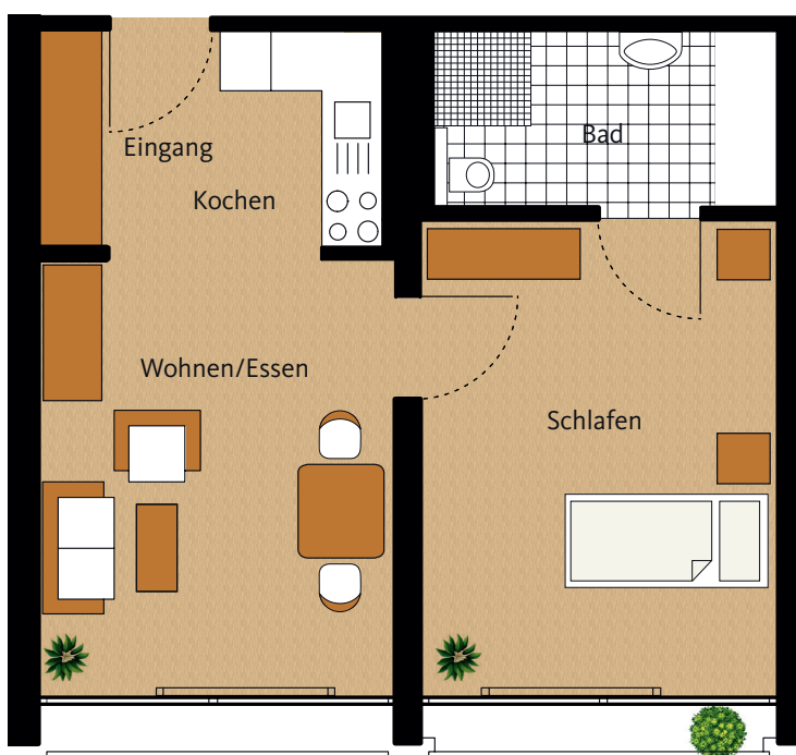
Grundriss Wohnung 519