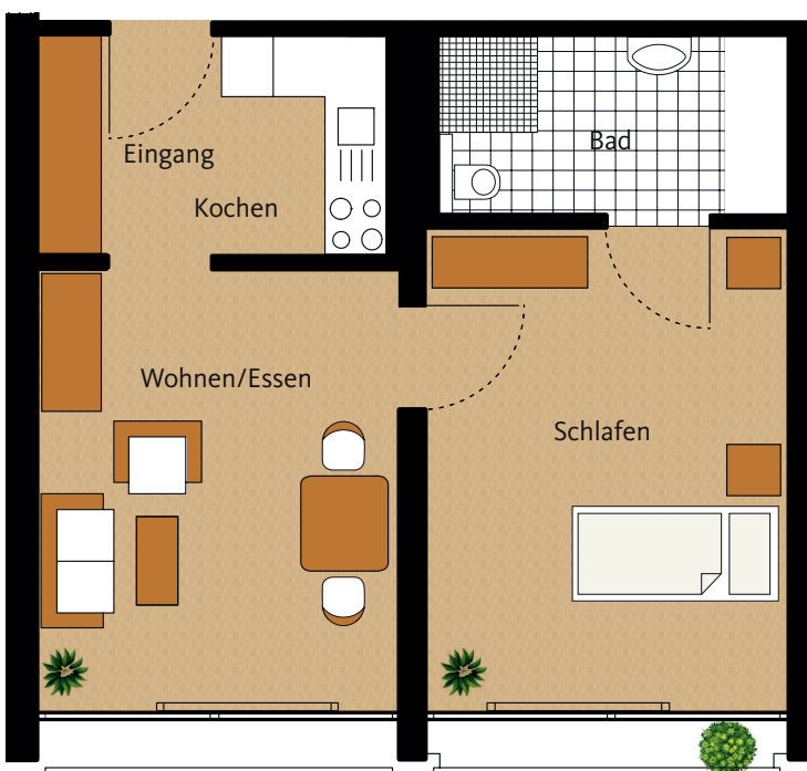
Grundriss Wohnung 514