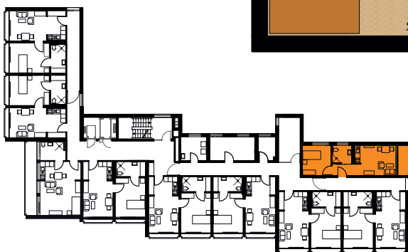
Grundriss des Hauses – 5. Obergeschoss