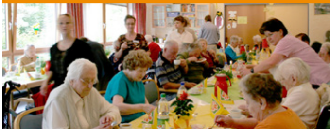
Kommt gut an! Mithilfe bei Festen und Veranstaltungen.